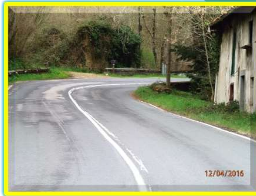
Salida de la carretera N-634