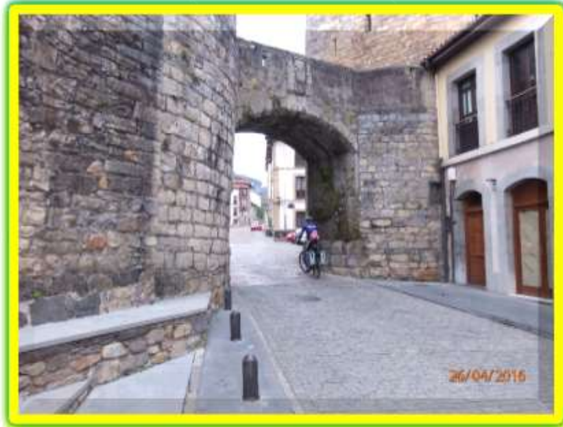
Arco del Castillo