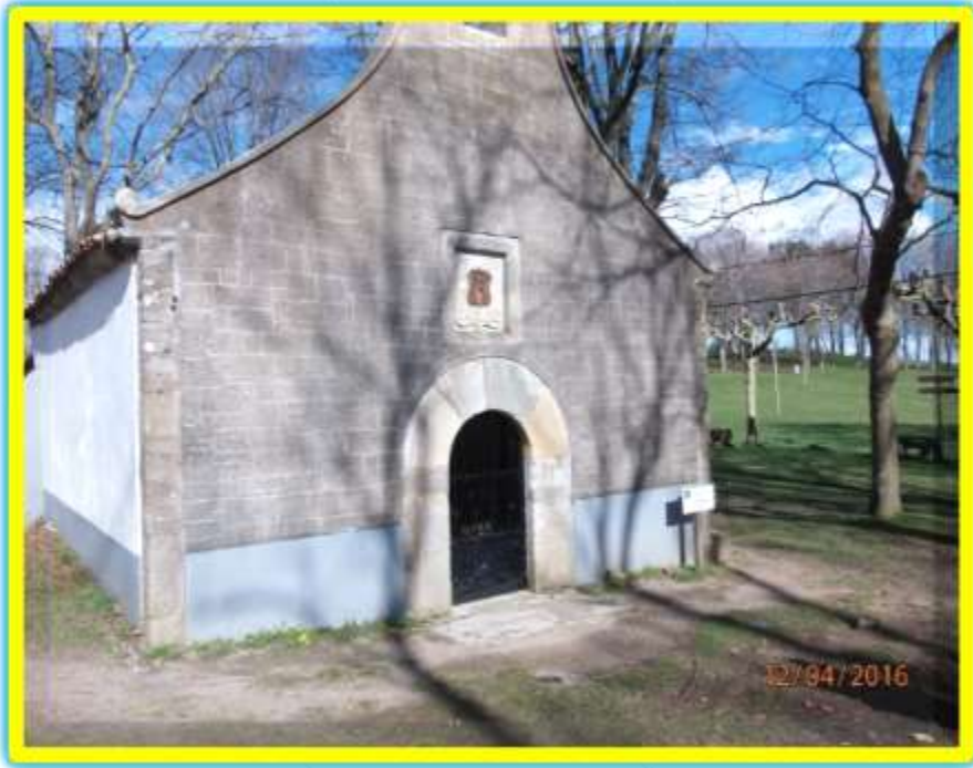
Ermita de San Roque. Tineo