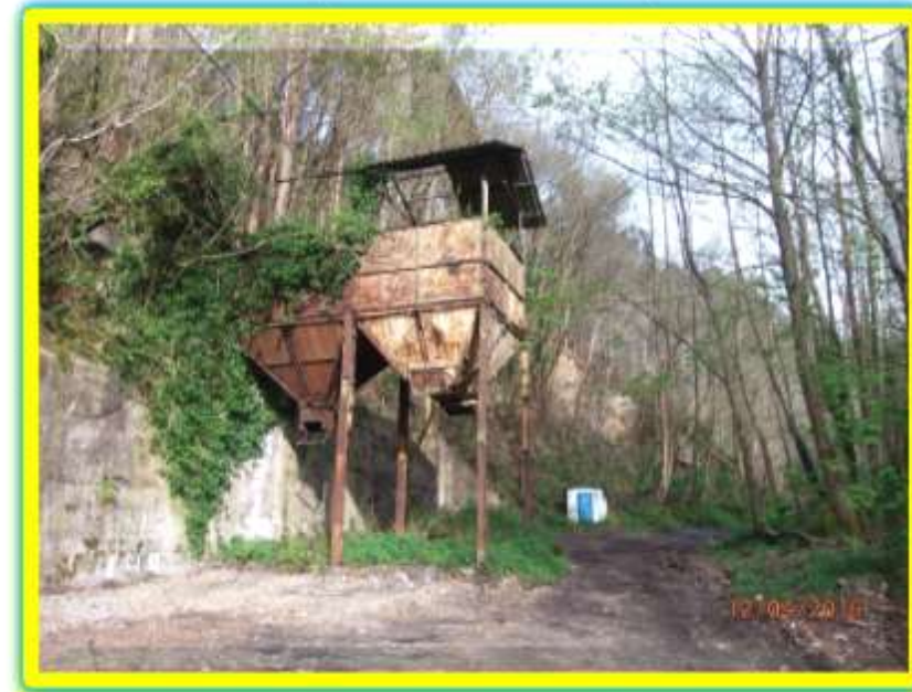
La Tolva de mineral