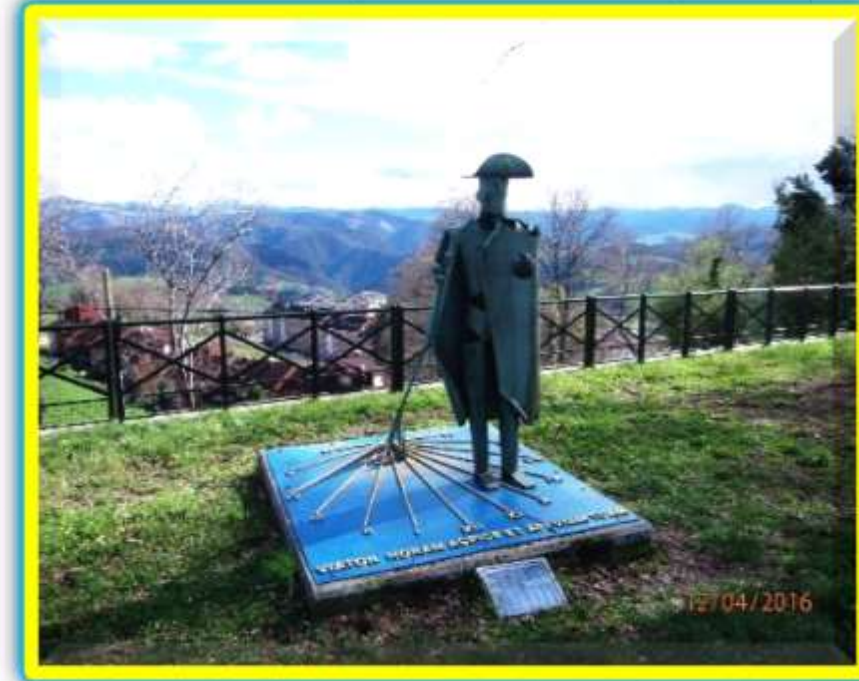
Monumento al Peregrino. Tineo