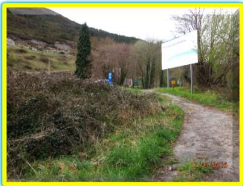
Salida a la carretera N-634