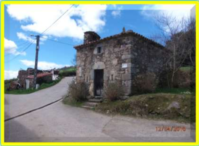
Ermita del Cristo de los Afligidos. La Pereda