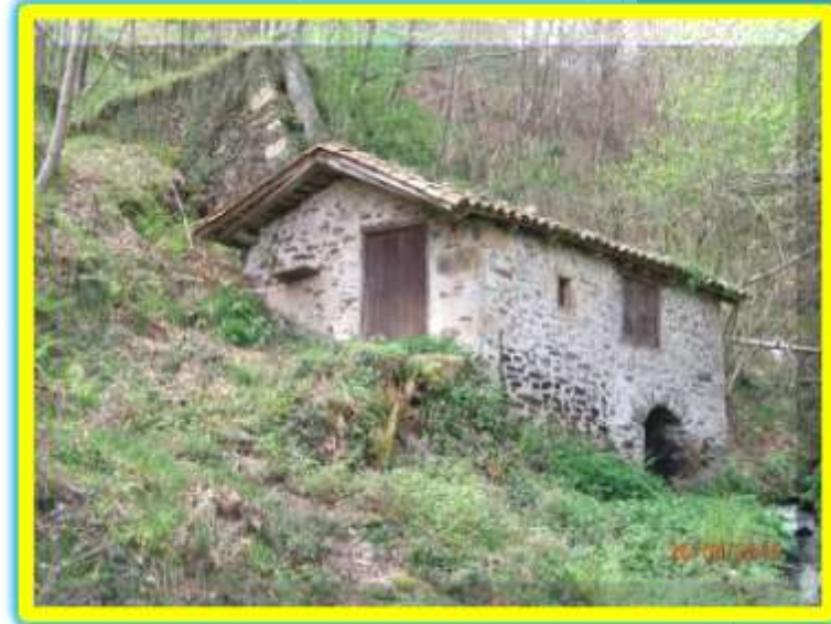
El Molino de Berdures