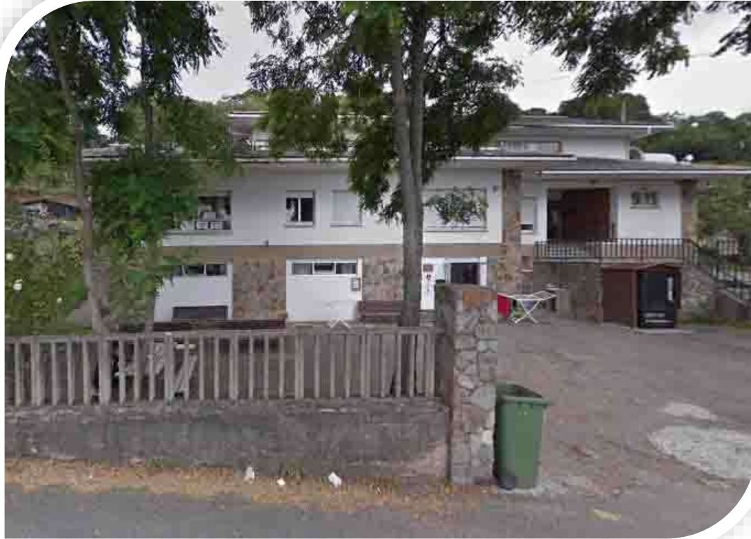
Alberque Municipal de Tineo