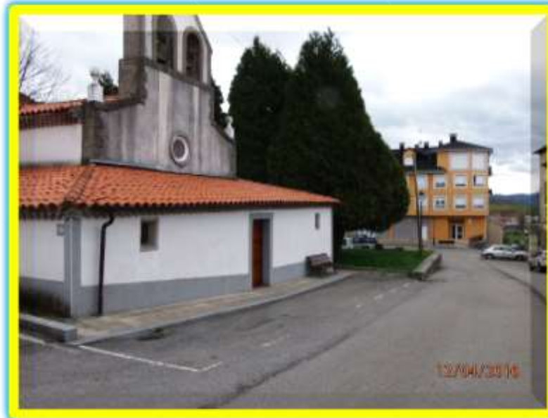
Iglesia de San Vicente de La Espina