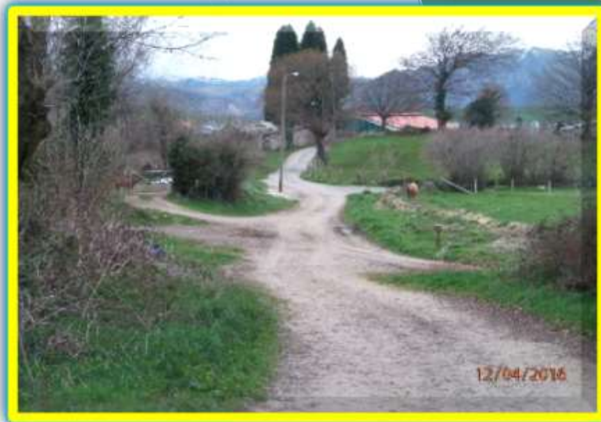
Santa Eulalia de Miño