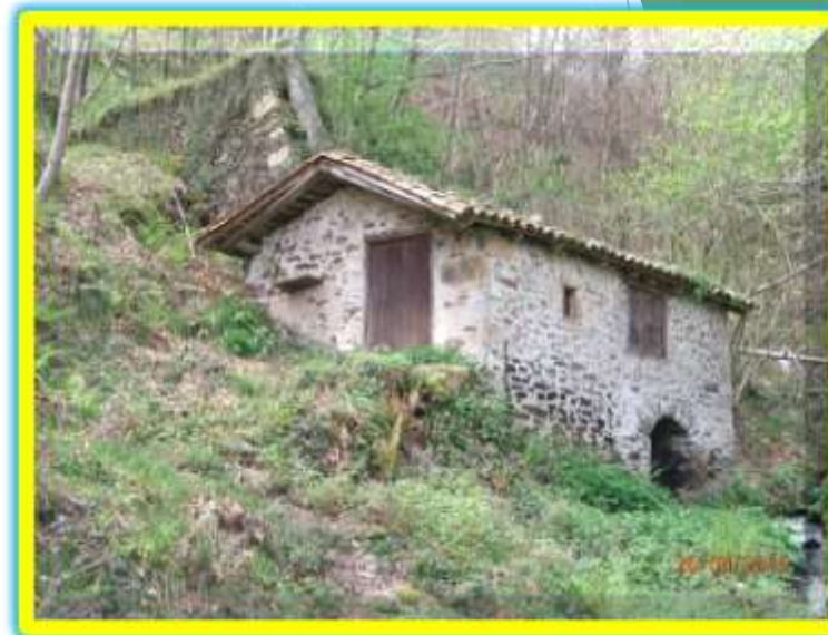
El Molino de Berdures