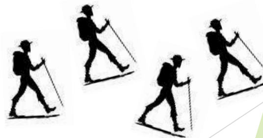
Para descansar un poco