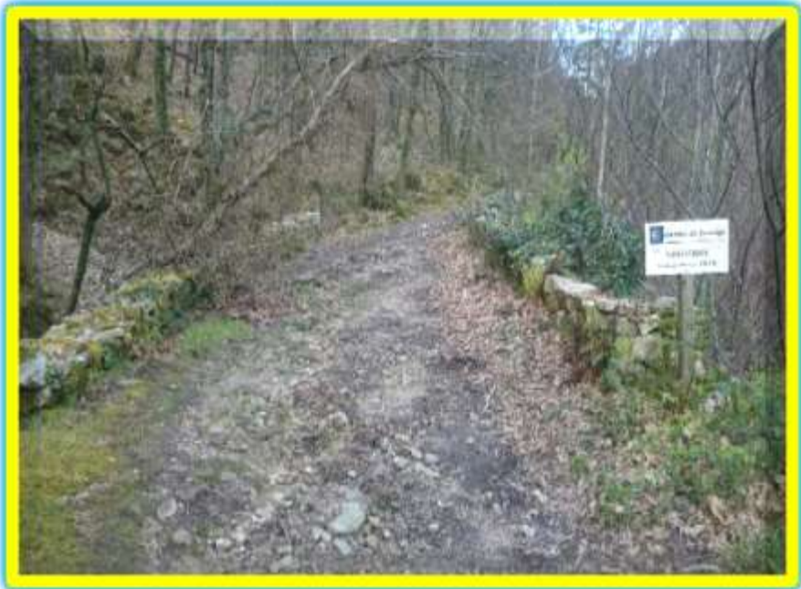
Puente de Borra