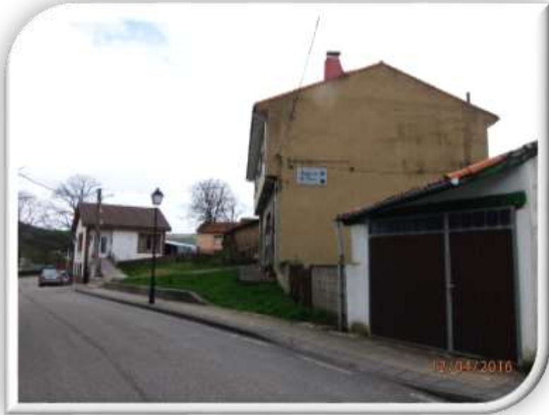
Albergue El Texu en La Espina