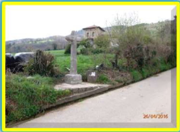
Casa La Torre o de Begega