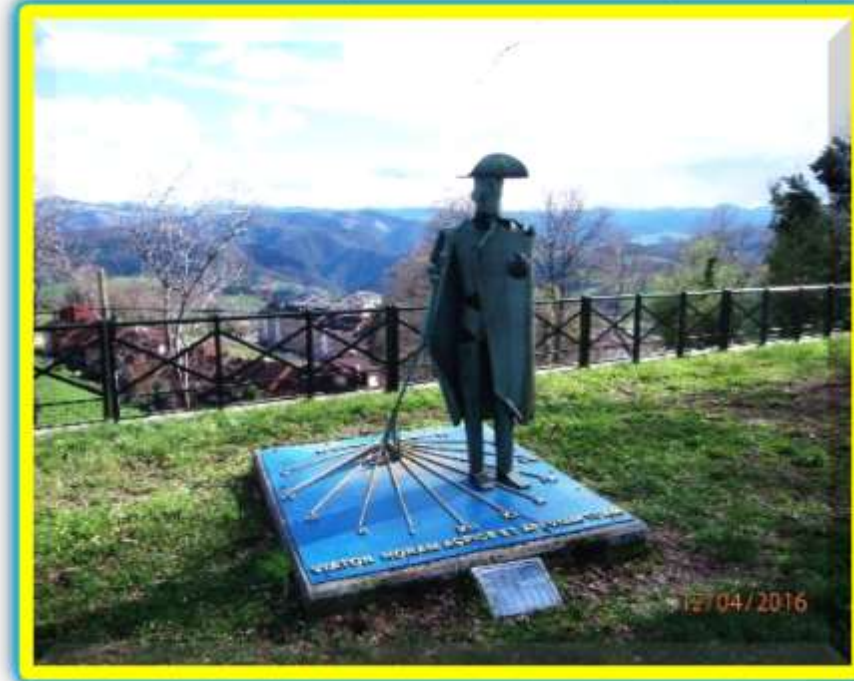
Monumento al Peregrino. Tineo