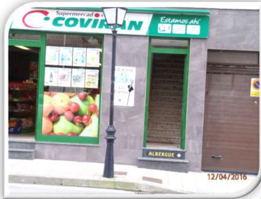
Albergue El Cruce en La Espina