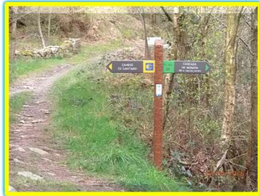
Puente de Carcabón y el desvío a la cascada del río Nonaya