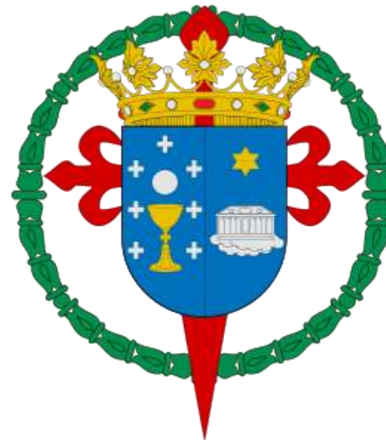
Santiago de Compostela