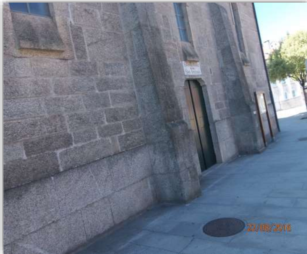
San Lázaro Iglesia de San Lázaro