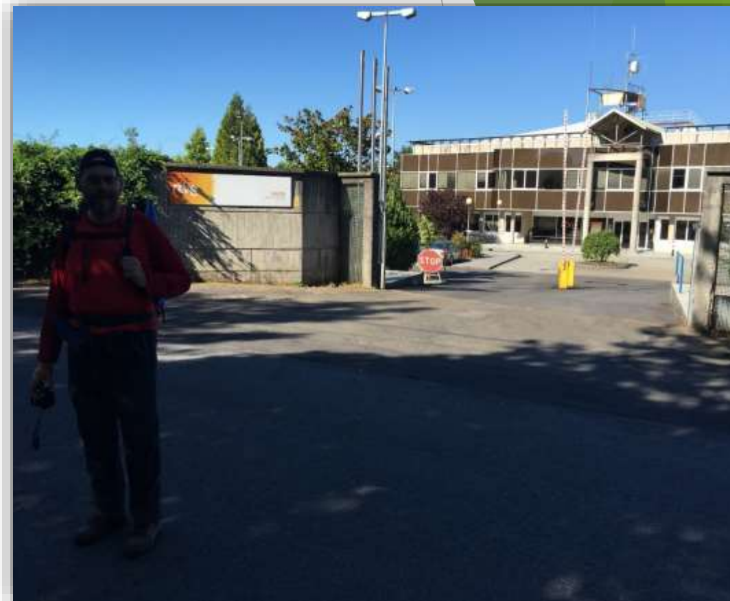
Instalaciones Televisión Española