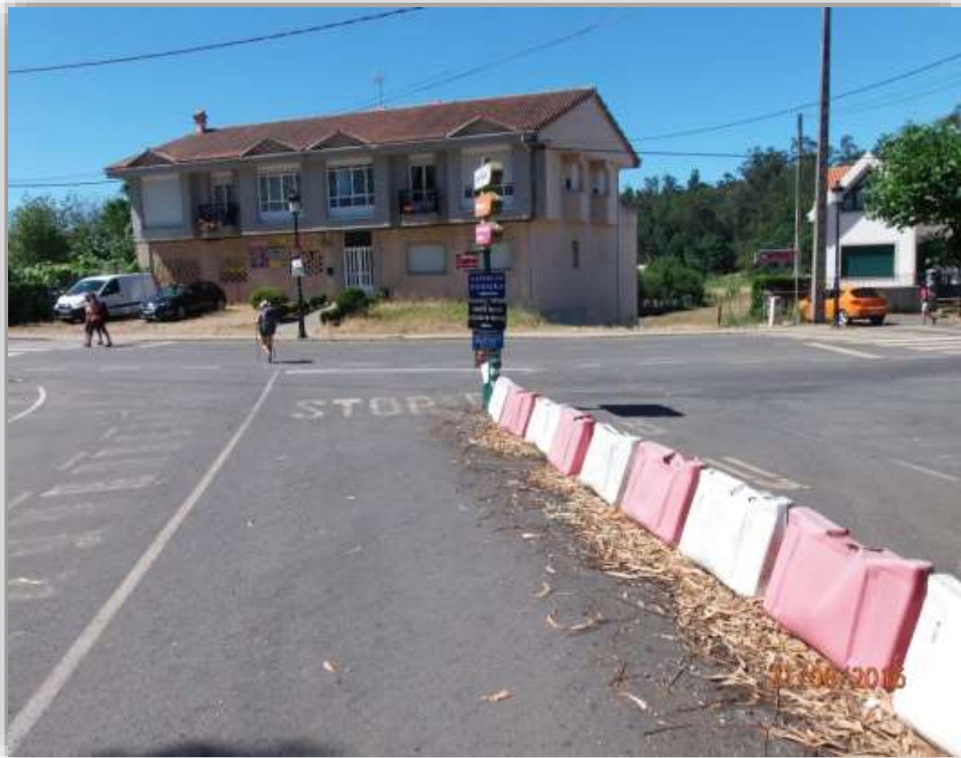
Cruce entrada O Pedrouzo

O PEDROUZO (ARCA) SANTIAGO DE COMPOSTELA