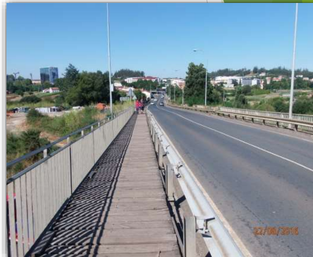
Viaducto San Lázaro