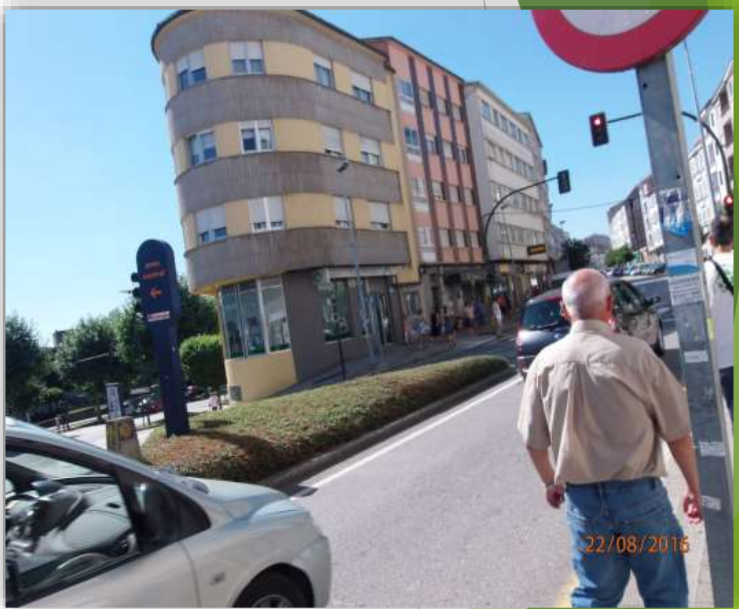
Rua Dos Concheiros