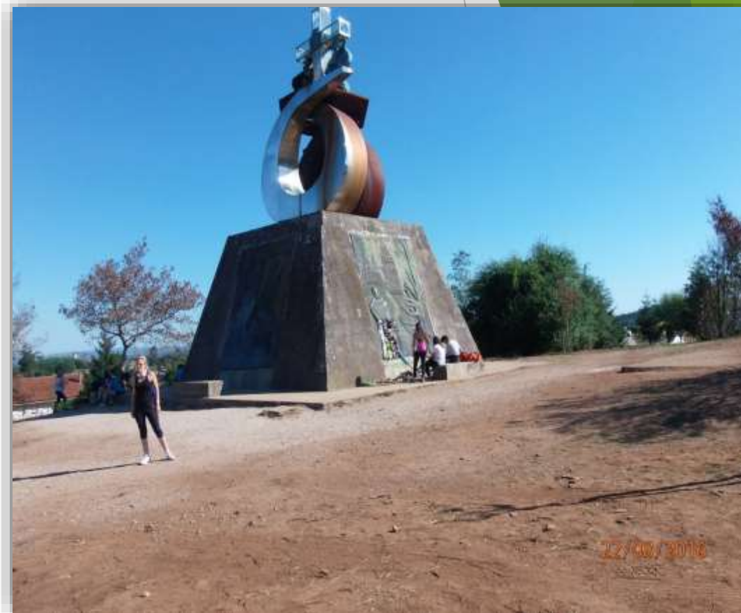
Monte do Gozo