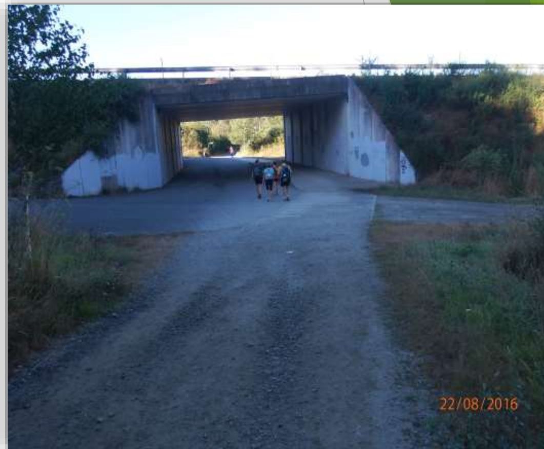
Cruzar bajo carretera AC-250