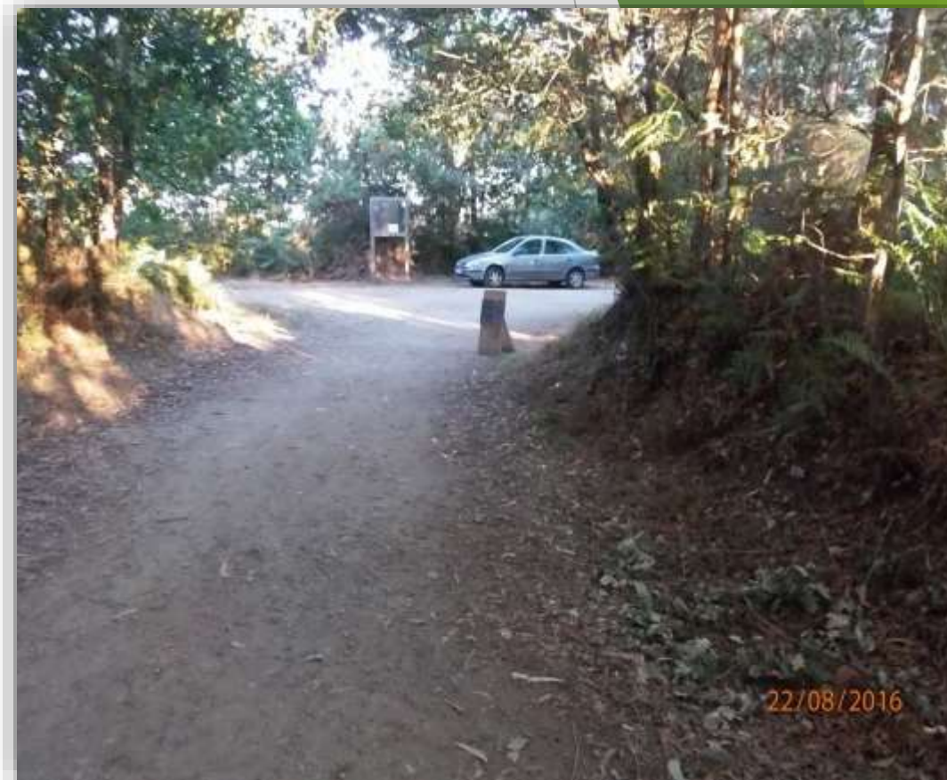
Fin subida do Amenal