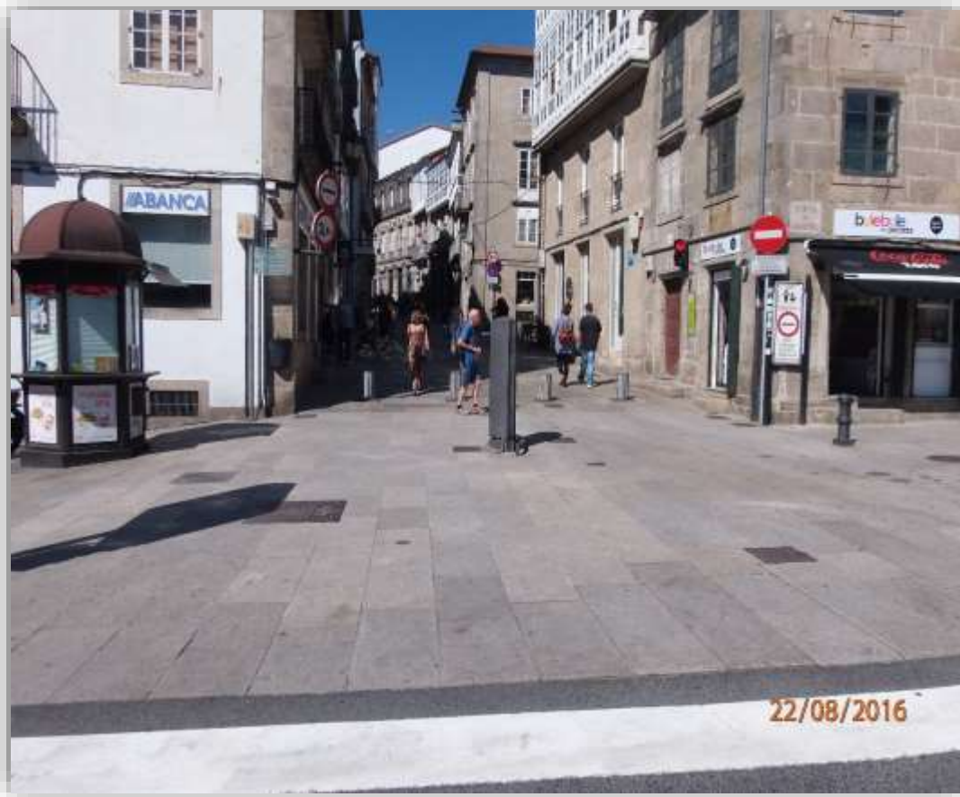
Calle Casas Reales