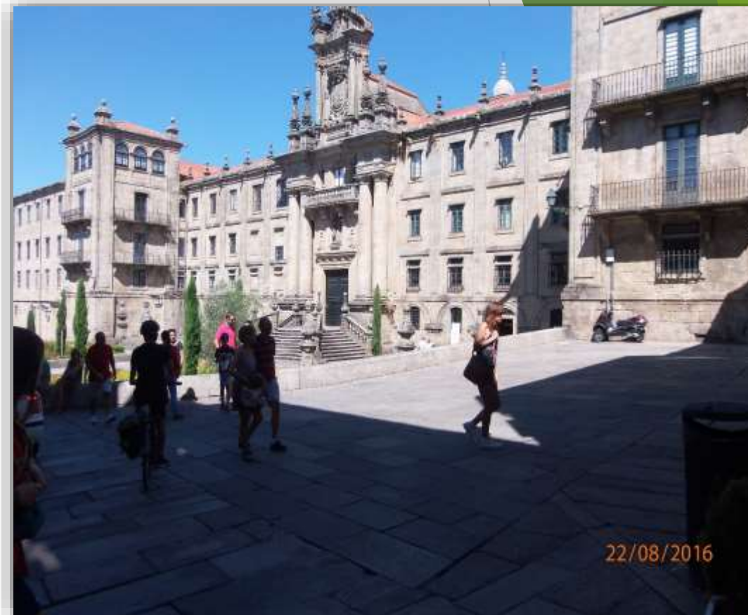
Plaza de la Inmaculada