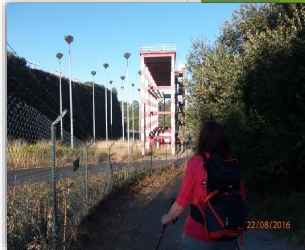
Cabecera pista aeropuerto