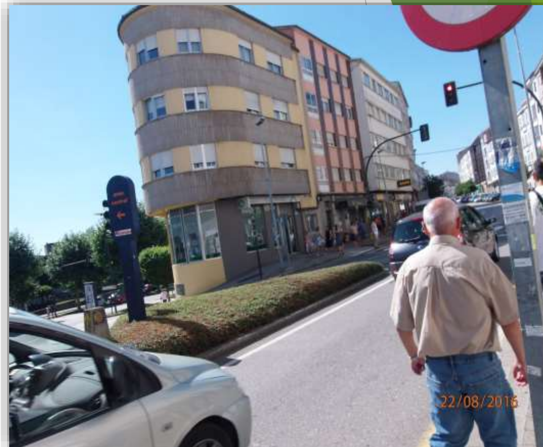
Rua Dos Concheiros