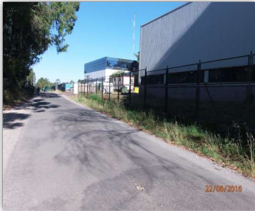
Instalaciones Televisión de Galicia