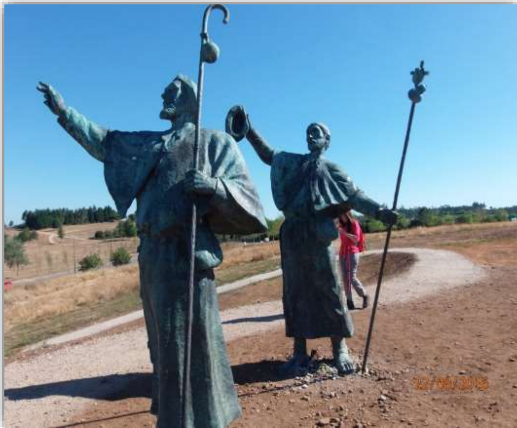
Monumento al Peregrino