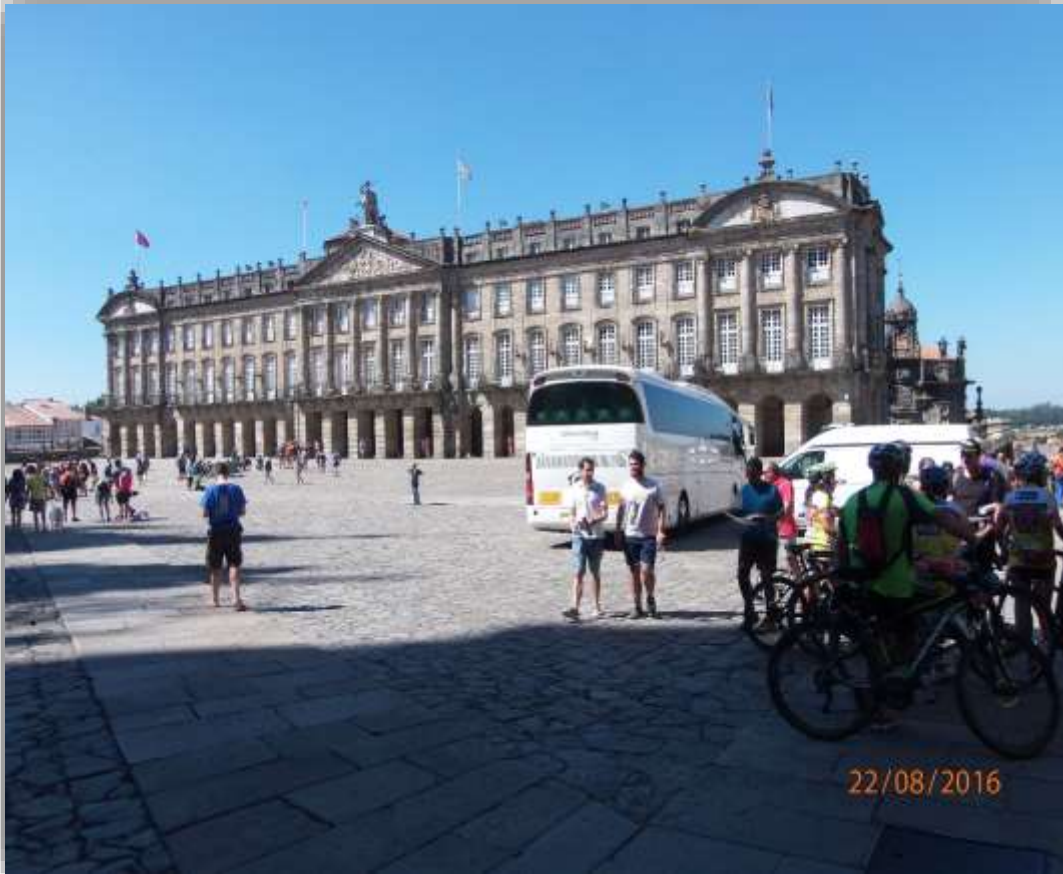
Plaza del Obradoiro