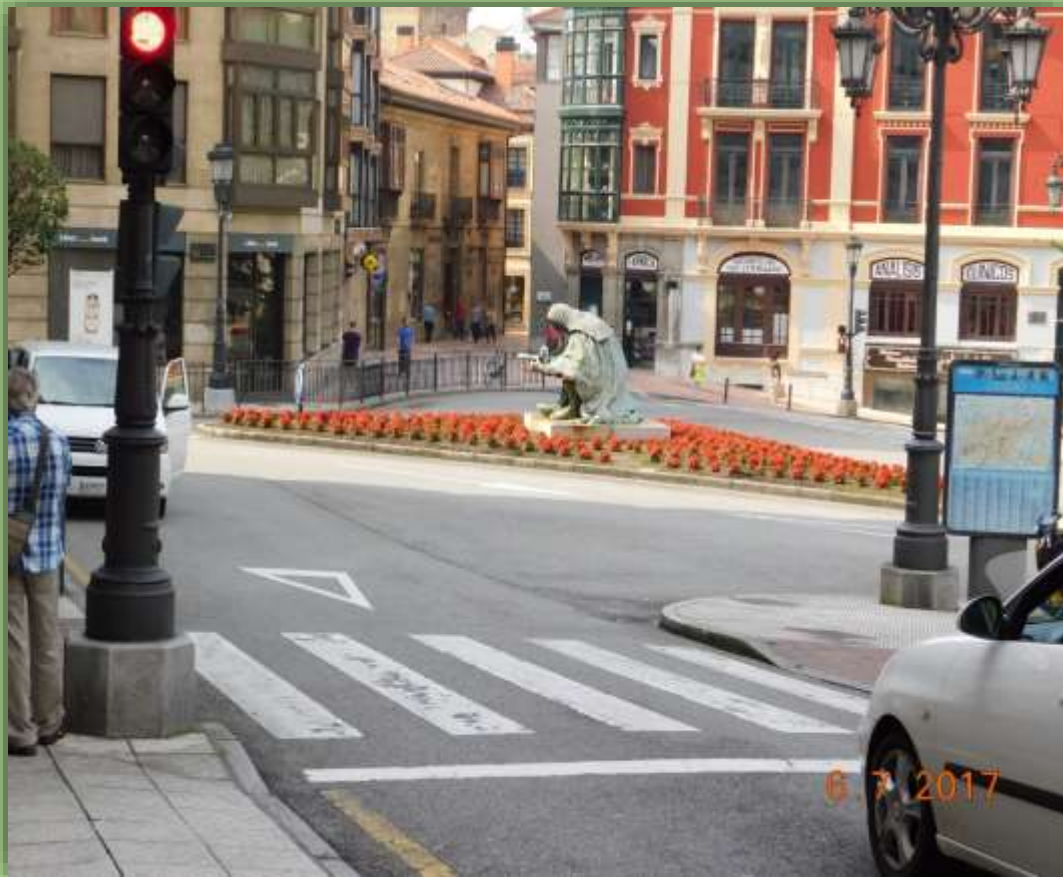
Estatua monumento al Conde Pedro Rodriguez Campomanes de Amado González Hevia (Favila)