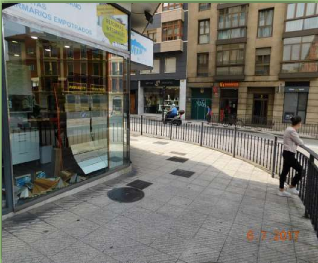
Gire a la izquierda hasta el paso de peatones.