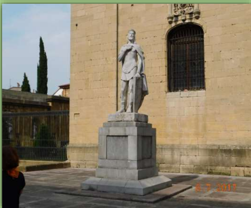
Al lado mismo de la puerta de la Catedral la Estatua de Alfonso II rey de Victor Rey Granda.

Alfonso II fue el primer peregrino y, a quien debemos que el Camino de Santiago y especialmente el Camino Primitivo ocupara un lugar en la Historia.