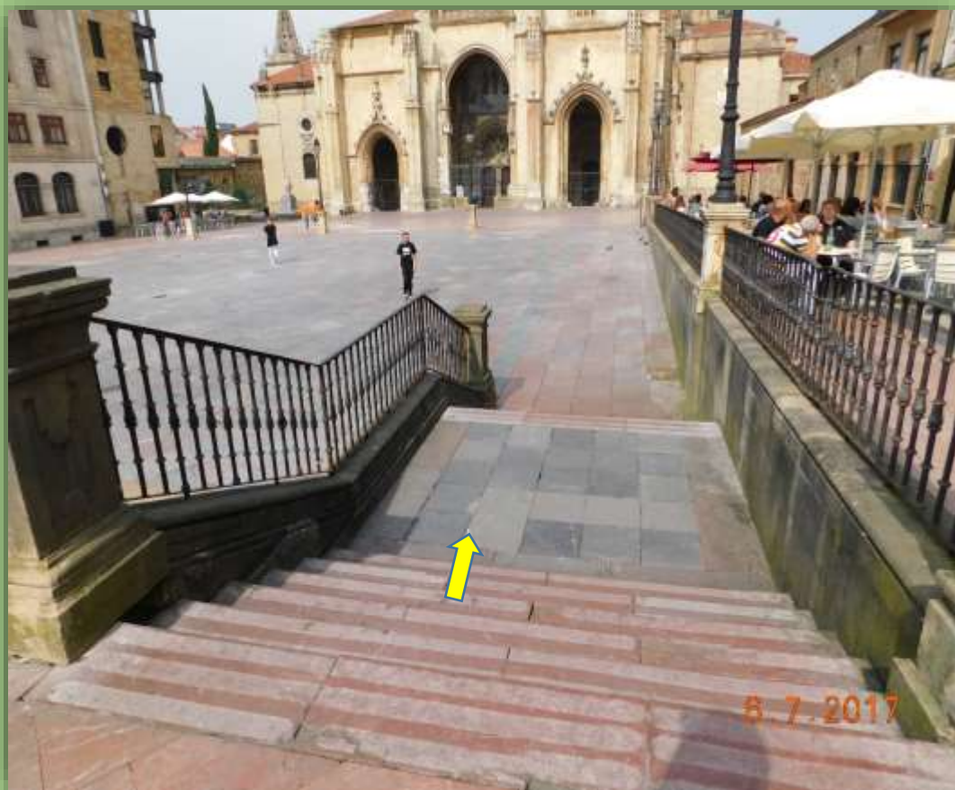
Plaza de Alfonso II el Casto.